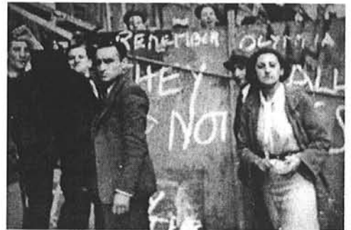
„They shall not pass!“ – Sie werden nicht durchkom-

Die Führung der Labour-Party und andere Abwiegler hatten aufgerufen, sich dem Aufmarsch der Mosley-Schwarzhemden nicht entgegen zu stellen, sondern sich davon fern zu halten. „Frieden und Ordnung“ seien oberstes Gebot. Hunderttausende waren jedoch entschlossen, den Nazi-Aufmarsch unter allen Umständen und mit allen Mitteln zu verhindern.