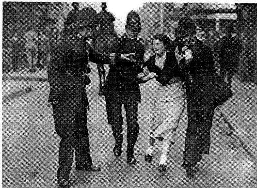
Die Polizei ging mit großer Brutalität gegen die AntifaschistInnen vor und nahm viele Verhaftungen vor. Danach wurden zahlreiche DemonstrantInnen zu Haftstrafen, teilweise mit Zwangsarbeit verurteilt.

Es gab zahlreiche Organisationen, welche zum Kampf mobilisierten. Dazu gehörten etwa „The Jewish People's Council Against Fascism and Anti-Semitism“ sowie verschiedene Gewerkschafts- und Erwerbslosenorganisationen. Eine Rolle spielte aber auch die „Stepney Defence League“. Diese war von der kommunistischen Partei Großbritanniens zusammen mit einzelnen mutigen Kirchenleuten gegründet worden, um militant gegen Wohnungszwangsräumungen zu kämpfen. Dabei wurden auch schon mal Barrikaden errichtet.