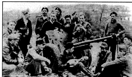
InterbrigadistInnen im spanischen Bürgerkrieg

Der geplante Nazi-Aufmarsch durch die Cable Street im Londoner East End war erfolgreich verhindert worden! Die antifaschistischen Kräfte erstarkten und wurden noch entschlossener. Ein Teilnehmer der damaligen Kämpfe berichtete 1996: „Ich war nur einer von zahlreichen Leuten, die, als Resultat von dem, was in der Cable Street geschah, fühlten, dass wir etwas tun mussten, um den Faschismus zu besiegen, dass wir dagegen zu den Waffen greifen mussten. Ansonsten würden nicht nur viele tot sein, sondern sie würden uns auch tausend Jahre zurück werfen. Ich ging nach Spanien, die Kommunistische Partei war die erste Organisatorin davon. Im Februar 1937 ging ich nach Spanien. Ich war ein erwerbsloser Seemann, ich war im Britischen Bataillon, der Major Attlee Company.“ (Searchlight Oktober 1996)