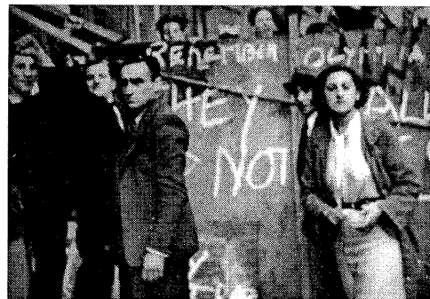
„They shall not pass!“ – Sie werden nicht durchkommen!“

300.000 AntifaschistInnen stellten sich am 4. Oktober 1936 im Londoner Eastend dem geplanten Nazi-Aufmarsch entgegen unter dem Ruf: „They Shall Not Pass“. Das war die englische Übersetzung der Anti-Franco-Parole „No Pasaran!“ aus dem spanischen Bürgerkrieg. Und trotz eines riesigen Polizeiaufgebots konnte der Aufmarsch der Mosley-Schwarzhemden durch das Eastend verhindert werden. Die Antifa-Kräfte brachten den britischen Nazis eine schwere Niederlage bei. Das schwächte deren Einfluss erheblich.